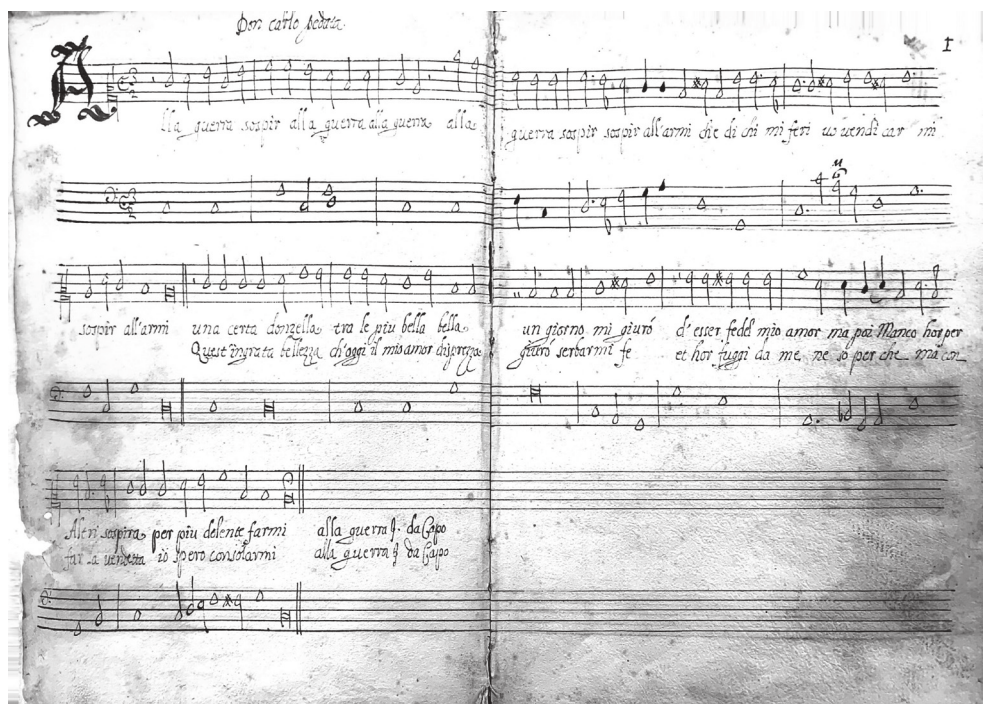
Es. 3: CARLO PEDATA, Alla guerra sospir , ms. B-Bc 17059, c.1

Oltre a numerose arie strofiche è molto frequente, fra le 132 composizioni, un altro tipo di struttura che “muove” la rigida e ordinata successione della stessa musica ripetuta su testo diverso, attraverso l’inserimento di un refrain (o meglio di un intercalare , per usare un termine diffuso in manoscritti romani seicenteschi) che apre la composizione e si ripete dopo ciascuna strofa [Esempio 3] 42 .