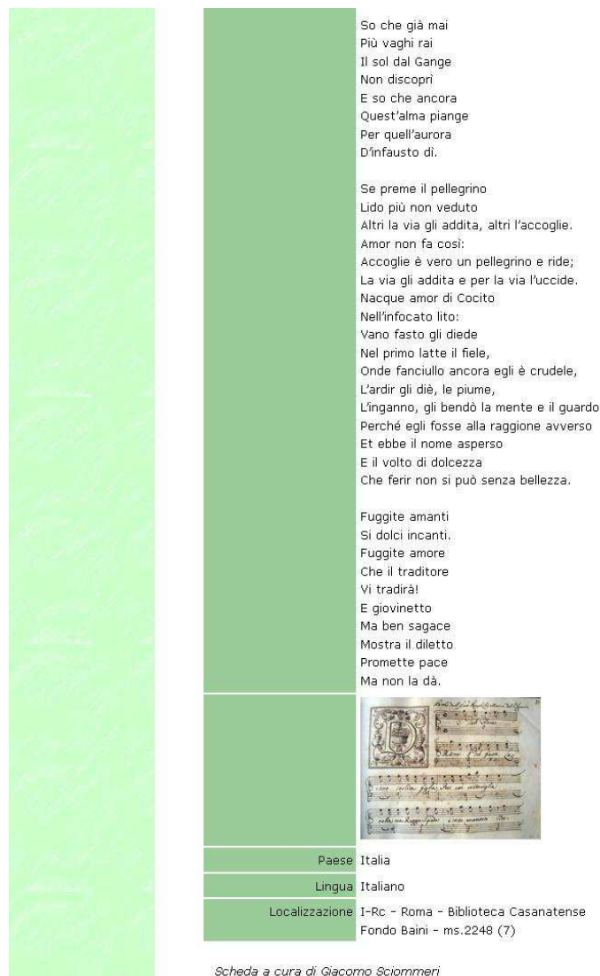
Fig. 3- 4. Record in Clori. Archivio della cantata italiana

Nella maschera di catalogazione sono stati aggiunti alcuni campi specifici, meta e paratestuali, che vanno ad arricchire la descrizione catalografica e che offrono nuove e interessanti informazioni fruibili dagli studiosi di questo genere musicale. I campi aggiuntivi sono: