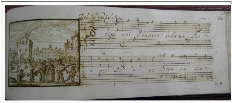
Fig. 2. ROMA, BIBLIOTECA CASANATENSE, Fondo Baini, Ms 2478 (2)

Clori. Archivio della cantata italiana è ospitato sul server della Biblioteca Nazionale Braidense di Milano grazie ad una convenzione con l'Ufficio Ricerca Fondi Musicali ed è realizzato interamente con software open source ; il cuore del sistema è costituito dal database relazionale ad oggetti PostgreSQL, che gestisce i record catalogafici e gli authority file; è possibile accedere ai dati nel database attraverso due interfacce web distinte, una di ricerca (disponibile all'utente) e una di amministrazione (per catalogatori e amministratori del sistema), entrambe realizzate in PHP.