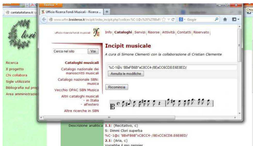
Fig. 5, Visualizzazione dell'incipit musicale tramite il sito dell'URFM