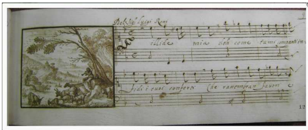
Fig. 1. ROMA, BIBLIOTECA CASANATENSE, Fondo Bainsi, Ms 2478 (2)

Questo “nuovo approccio”, multidisciplinare, si realizza quindi nell’approfondimento di aspetti che vanno oltre la catalogazione delle fonti musicali di questo genere musicale, che rappresenta “solo” il punto di partenza del progetto. Si pensi per esempio a studi di italianistica sui testi poetici, alla possibilità di attribuire testi altrimenti anonimi o con attribuzioni multiple, a ricerche più strettamente musicologiche sullo stile, la prassi esecutiva, gli interpreti, la circolazione dei testi e dei compositori, gli organici vocali e strumentali, le strutture metriche e armoniche, il problema del basso continuo, ma anche ad approfondimenti storico-musicologici sui soggetti (personaggi, località, eventi storici, ecc.), i contesti e le funzioni, la committenza, le occasioni e i centri di diffusione della cantata, senza dimenticare indagini sulla provenienza delle fonti (destratificazione e ricomposizione di fondi), su copisti e copisterie, inchiostri e filigrane. Un ulteriore contributo potrà inoltre pervenire dagli storici dell’arte, dai quali potrà arrivare un importante aiuto per decifrare capilettera e miniature che precedono l’inizio delle cantate; in alcune raccolte cantatistiche ci sono vere e proprie opere d’arte e la collaborazione con storici dell’arte potrebbe essere illuminante per descrivere il contenuto illustrato, interpretare il messaggio rappresentato e contestualizzare i manoscritti.